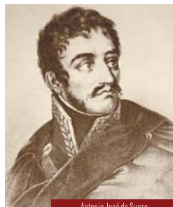
Antonio José de Sucre.

Con poco tiempo de diferencia fallecieron dos de los mayores líderes de la causa emancipadora. ◀