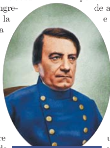
José María Paz.

eco del enfrentamiento entre el bloque de provincias unitarias y el de las federales. Mientras que para los primeros los federales son unos vándalos y el gobierno porteño representa un peligro para la gente decente, para los segundos, Paz y sus comandantes no son más que unos iracundos y rústicos déspotas militares. En materia de organización política los diarios mediterráneos favorecen la creación de un poder constitucional concentrado que contribuiría a mejorar la calidad de las instituciones de las provincias. Excepto alguna voz aislada, la mayor parte de la prensa porteña rechaza la idea de una fusión entre unitarios y federales así como también la participación de Buenos Aires en un congreso que correría el serio peligro de ser dominado por los unitarios como en la última experiencia constituyente. Respaldada así, por un lado, la cesión por parte de la Legislatura de facultades extraordinarias al gobernador Rosas, recurso que prevendría presuntos complotos de unitarios, y por otro, una política de organización gradual de las provincias. B